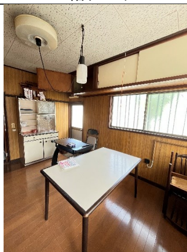
1階ダイニングキッチン